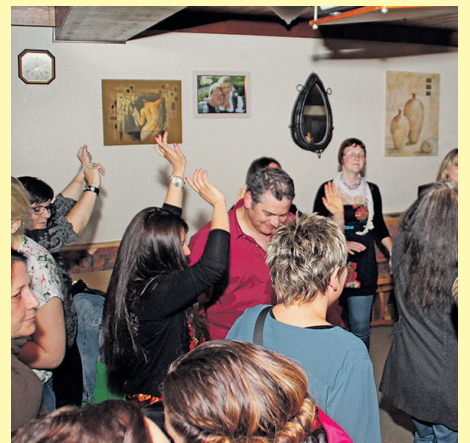
Die Kulttour in Treuchtlingen findet heuer zum zehnten Mal statt und hat sich als Kneipenfest etabliert. Mehr Informationen zum Programm gibt es unter www.holm-music.de/kulttour-treuchtlingen/